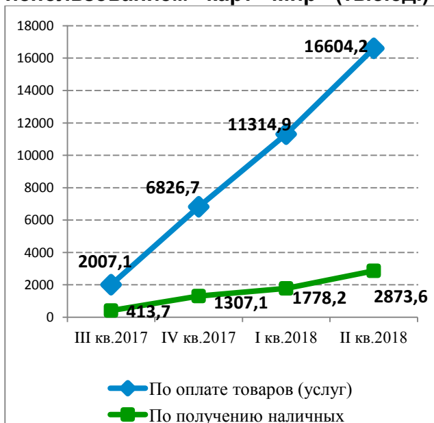
Динамика объема операций с использованием карт «Мир» (млн руб.)